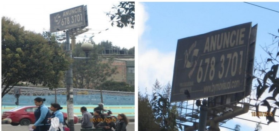
VISTA PANORÁMICA Y ANUNCIO DEL ELEMENTO DE PUBLICIDAD EXTERIOR VISUAL TIPO VALLA TUBULAR COMERCIAL DONDE SE ENCUENTRA INSTALADO.